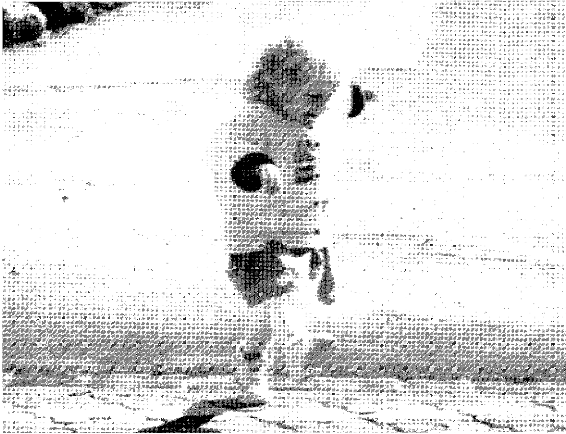
Tanzend die Welt erobern ... und wenn ich falle, werde ich «aufgefangen».

Von der grauen Theorie zum Grün des Lebens goldnem Baum?