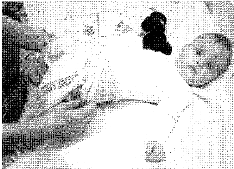
Es lohnt sich, dass ich mich anstreng...

oder in den Arm nehmen lassen, ein Pflaster bekommen, falls es sich verletzt hat... So gestärkt, kann die Erkundung der Umgebung auf eigenen Beinen wei-