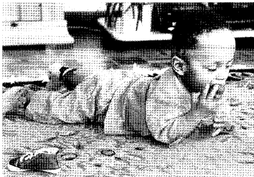
Versunken in die Untersuchung des Spielzeugs... und dann?